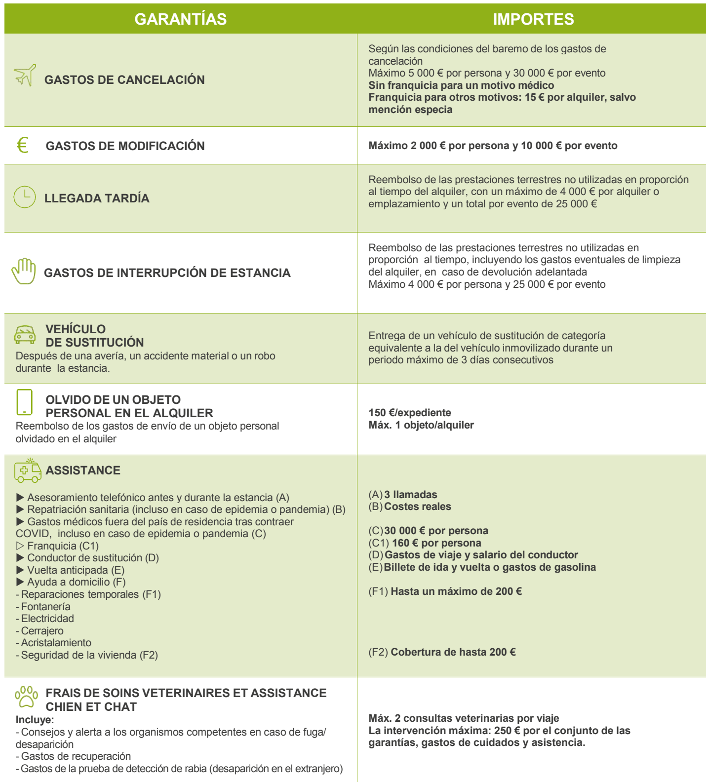
TABLA DE LOS IMPORTES DE LAS GARANTÍAS